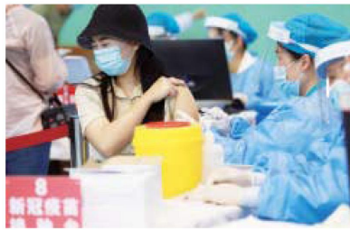
官渡区持续开展新冠疫苗接种。

本报讯 记者李婧/文 李进红 报道 约20.1万人完成首剂次或两剂次接种,6月底前建成100个“红星书屋”……4月28日上午,昆明市官渡区召开着力保障和改善民生新闻发布会,区卫生健康局、区民政局、区教育体育局、区文化和旅游局、区人社局相关负责人介绍重点工作及相关情况。 据介绍,目前官渡区已设置了16个新冠疫苗固定接种点,2个大型临时接种点,全区累计接种新冠疫苗约23.3万剂次,约20.1万人完成首剂次或两剂次接种,官渡区体育馆大型临时接种点、螺蛳湾临时接种点日均接种量在8000-10000剂次。 文旅惠民方面,今年将结合